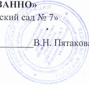
График работы медицинского работника ГУЗ «ЕРБ им. А.И. Козлова» в МКДОУ «Детский сад № 7» по адресу: Тульская область, г. Ефремов, ул. Ленина, д. 36 а